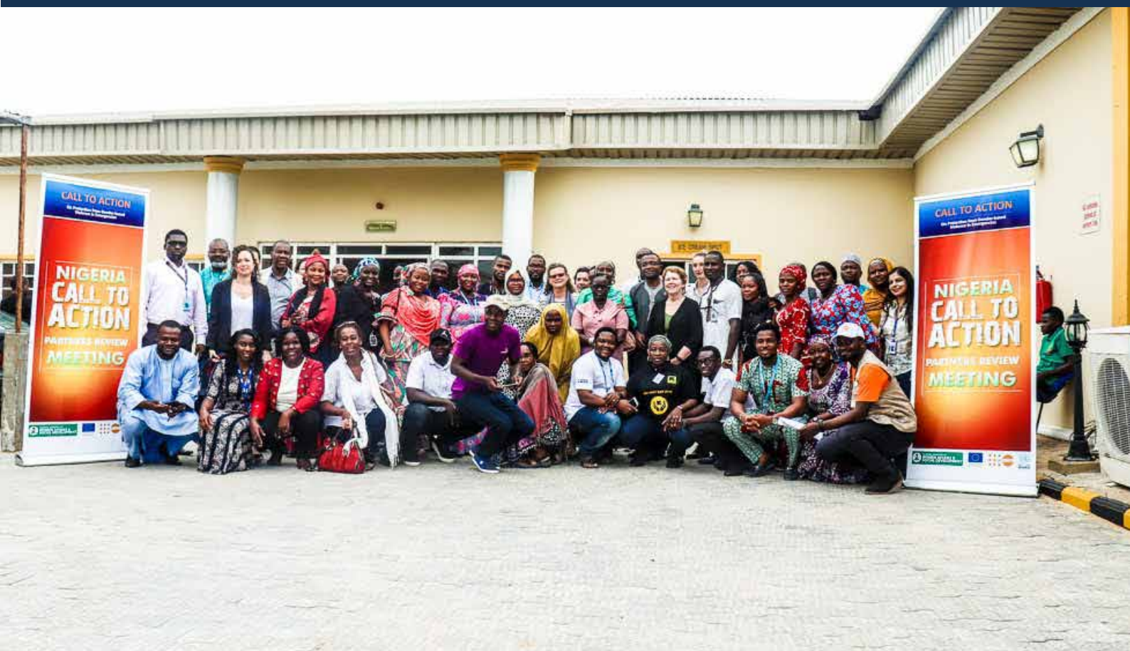
Reunión a mediados de año para examinar la Hoja de Ruta del Llamado a la Acción en Maiduguri (Nigeria), julio de 2013