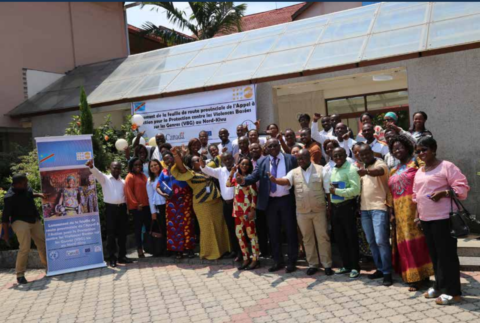
Presentación de la Hoja de Ruta del Llamado a la Acción en Kivu del Norte (RDC), marzo de 2019